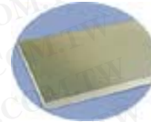
不 锈 钢 桌 面

材质: 桌面使用特殊成型高压纤维板，桌面加贴绿色软性压纹面合成胶面，桌边四面并以 PVC 胶条封边以保护桌边不易受损。