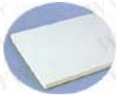
耐 磨 桌 面