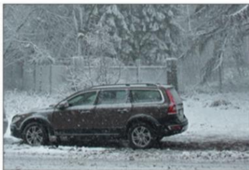
【寒冷导致打不着火】