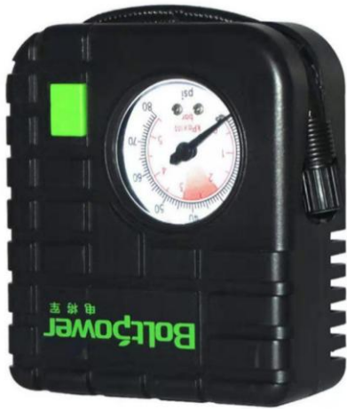
便携式充气泵 直接接移动应急电源使用