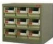
HD-309 (43-01) 550wx400dx440Hmm