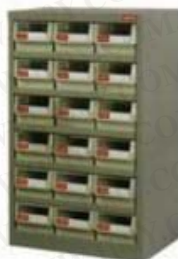
HD-318 (43-02) 550wx400dx880Hmm