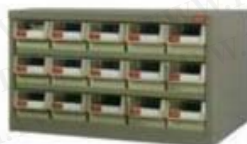
HD-515 (43-03) 880wx400dx440Hmm