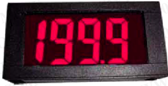
DPM-740X 系列 (LCD)背光