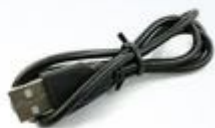
E104-BT5032A-TB + USB供电线