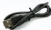
E104-BT5010A-TB + USB供电线