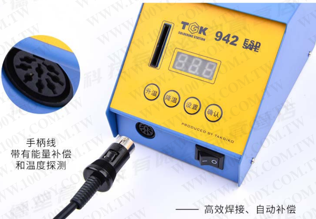
手柄线 带有能量补偿 和温度探测

一方面可以保持主机持续恒定的电压温度输出。 另一方面也可以保护焊接对象，以免线路板或其他焊接对象因温度低而产生虚焊、或因温度高而而烫坏铜皮。