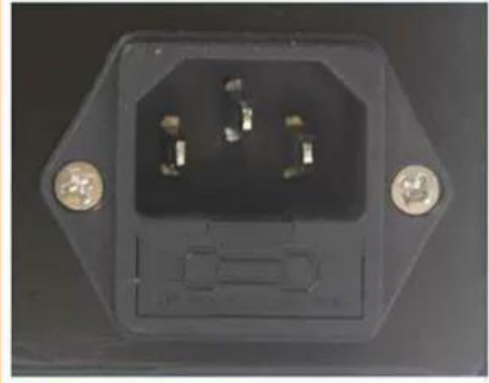
带保险丝电源插座 带保险丝电源插座, 双重保障, 使用放心