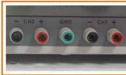
输出端 端口上面都有号显示, 请按照指示 进行操作