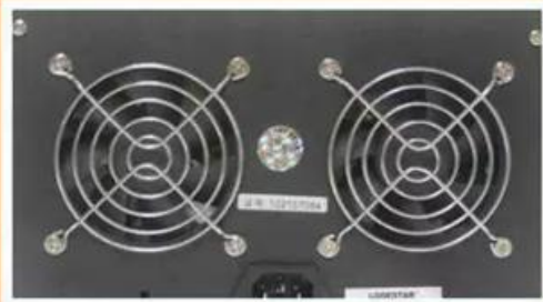
智能控温散热风扇 双风扇高效缓解仪器内部热量