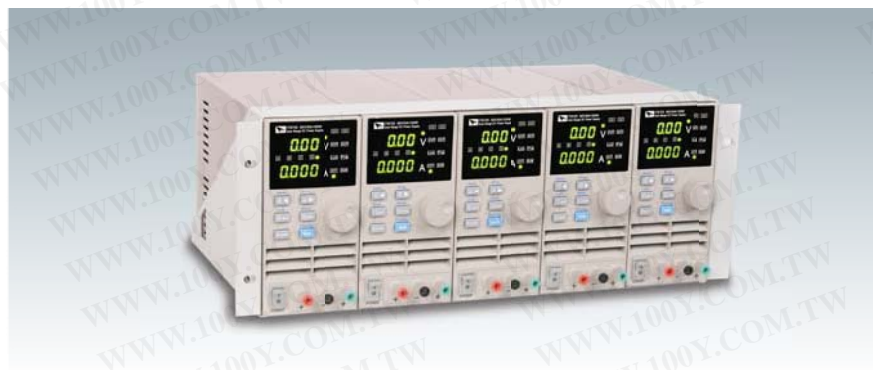
IT-E152 19" 機框安裝示意圖