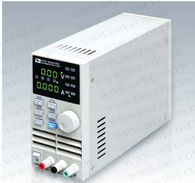
IT6720 60V/5A/100W IT6721 60V/8A/180W