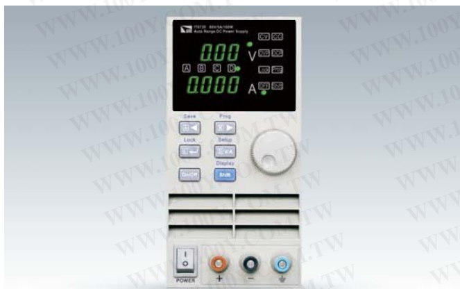
IT6720 60V/5A/100W IT6721 60V/8A/180W