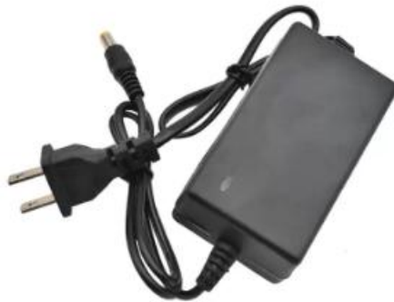
12V 2A 电源

USB转TTL转接板上的5V电源可以给小于4.3寸以下的串口屏直接供电，大于等于4.3寸的建议给转接板接上外置电源，否则电脑的USB供电能力不足会导致屏幕工作时出现花屏，闪屏等异常。