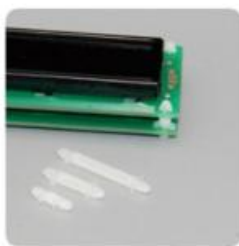
0306 PC板隔離柱 MINIATURE SUPPORT POST