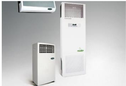
空气净化处理系统