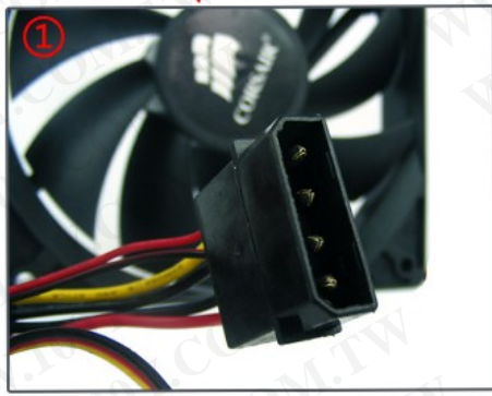
大4PIN电源（母）接口，转接到D型插口供电，不占用主板风扇插口。