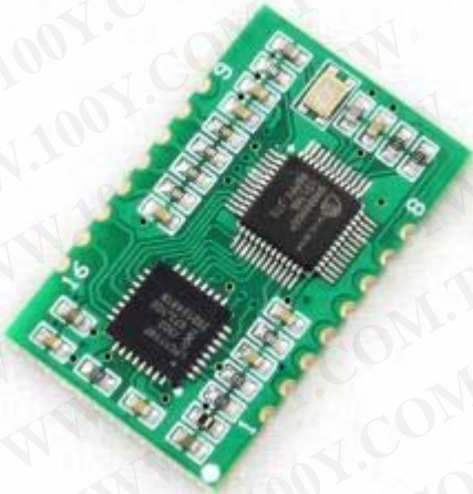
貼片式 TTL 串口轉乙太網模組