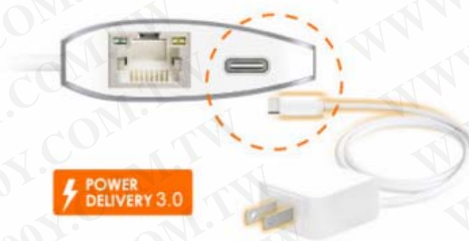
Type-C支持PD3.0充电功能 及资料传输功能等