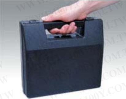
靜電測量計屬精密儀器, 附帶專用手提箱, 方便收藏及攜帶。

勝特力材料 886-3-5753170 勝特力电子(上海) 86-21-34970699 勝特力电子(深圳) 86-755-83298787 Http://www.100y.com.tw