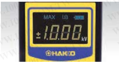
特大顯示幕, 數字清晰易讀。